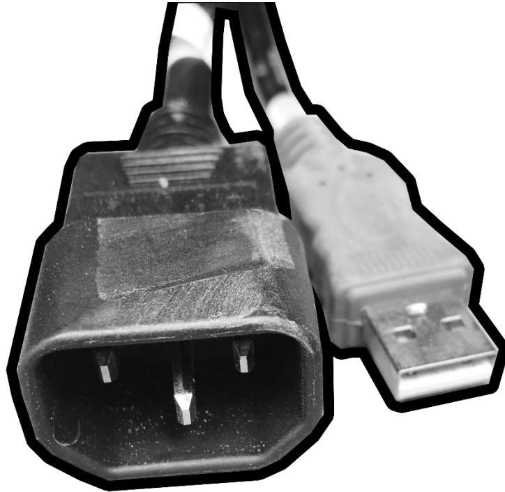
کابل های ورودی 1 تصویر

به طور کلی تمامی بلوک های استیج دارای دو پورت ورودی و خروجی هستند که هر کدام در یک طرف بلوک قرار دارند. کابل های ورودی و خروجی به شکل زیر شناسایی می شوند: